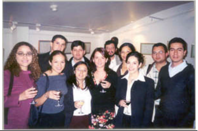
Estudiantes latinoamericanos del Diplomado y la Especialidad en Integración Europea.